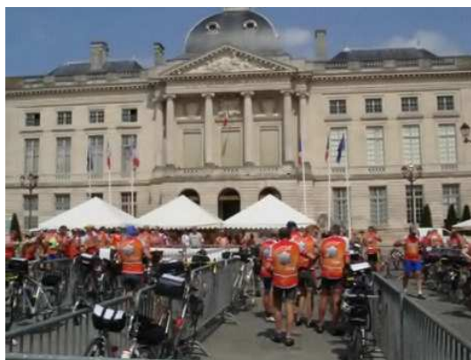
Tour cyclotouriste international. Etape à Chalons en champagne

Le travail se poursuit pour le tracé de la traversée de la champagne ardenne à VTT