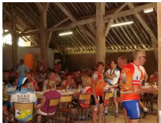
Tour cyclotouriste international. Etape à Chalons en champagne